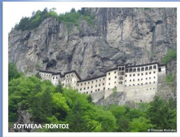
ΣΟΥΜΕΛΑ - ΠΟΝΤΟΣ

Ειδικός σχεδιασμός δύο διαφορετικών γνωστικών και ηλικιακών επιπέδων.